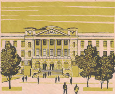
Новочеркасск Политехнический институт им. С. Орджоникидзе